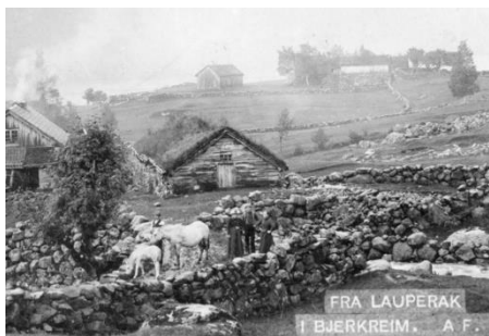
Lauperak 1896.