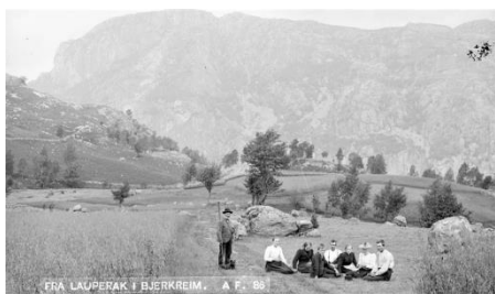
Lauperak 1896.