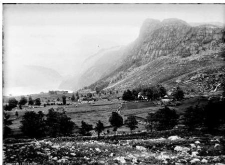
Lauperak i eldre tid.

Nye bilder legges ut fortløpende, så følg med!