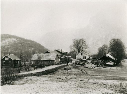
Lauperak sett mot vest ca. 1959.